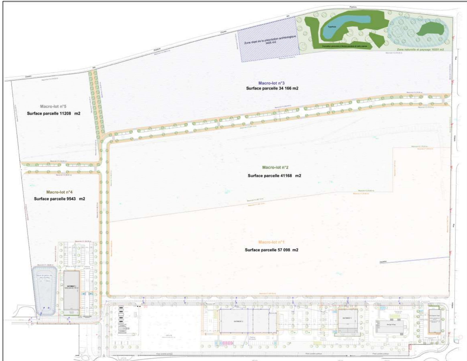
Figure 1 : extrait du plan de masse du projet