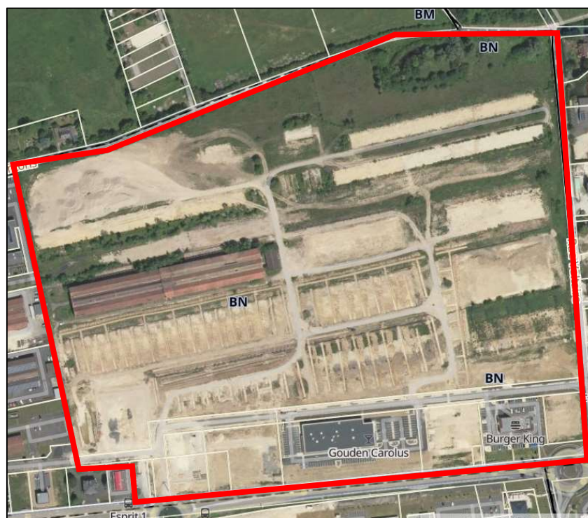
Figure 3 : Vue aérienne du site (mai 2020)