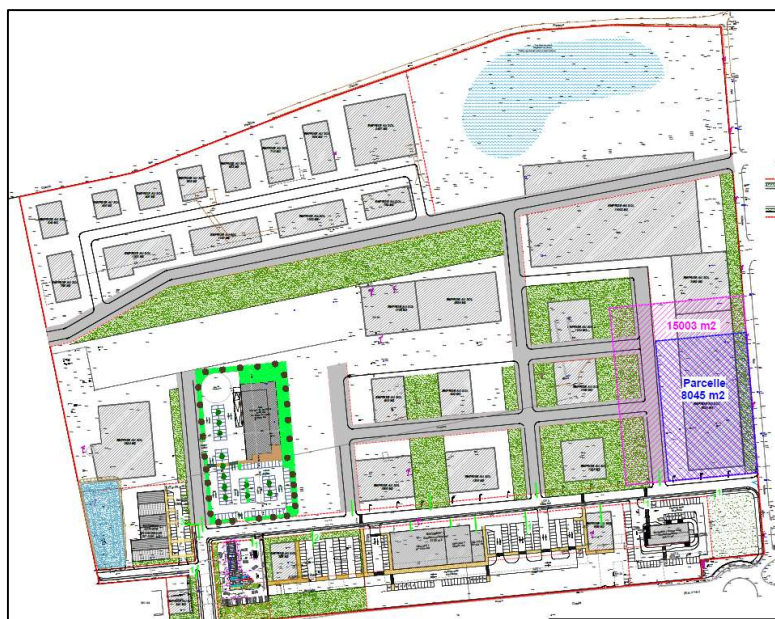
Figure 6. Projet au 24/09/2019

Le projet initial visait à l’installation d’activité tertiaires, d’artisanats mais également de commerces. Les accès principaux au site ont été déterminées (2 à l’est, 2 à l’ouest et 1 au sud). La zone au nord-est devait être entière consacré à l’installation d’un ouvrage de gestion des eaux.