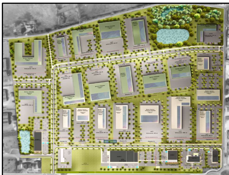
Figure 8. Projet au 21/10/2022.

Dans cette version la zone au nord du projet intègre un bassin de gestion des eaux tout en préservant une zone d'importance écologique composé notamment d'un étang (préservé).