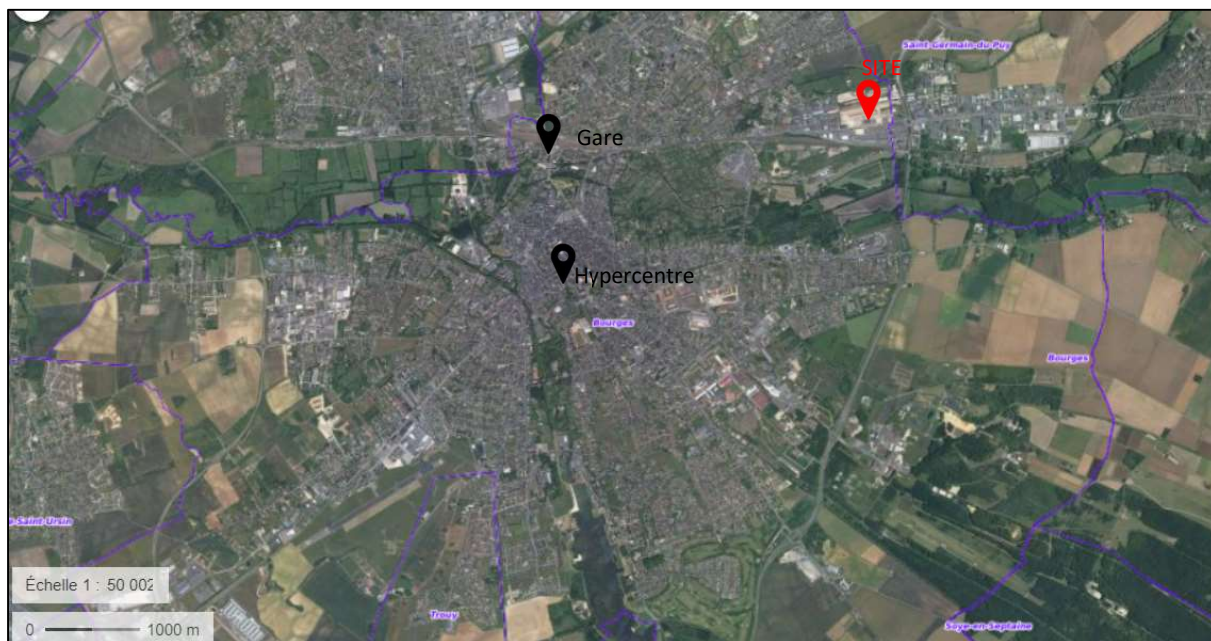
Figure 2 : Localisation du site sur fond cartographique de l'IGN 1/50 000ème

Le projet est implanté sur les parcelles cadastrales numérotées 45, 184, 185, 186, 187, 188, 190, 191, 192, 193, 194, 195, 196, 197, 198, 199 sections BN, situées en bordure de la RN151. La surface totale du terrain étudié est de 22 ha.