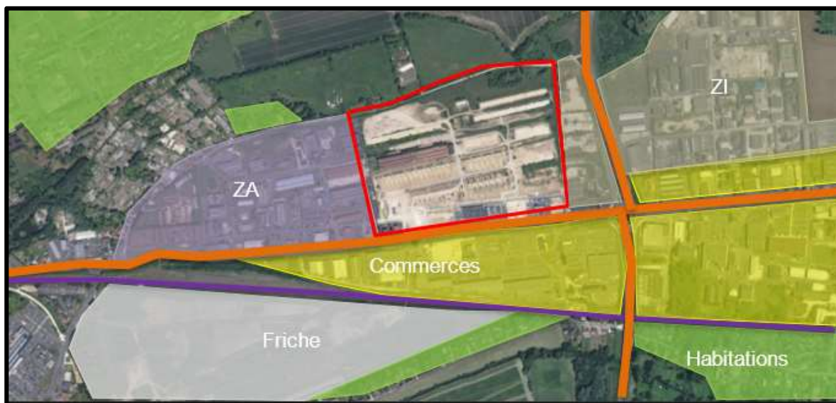
Figure 4 : Environnement proche du site, 2021.