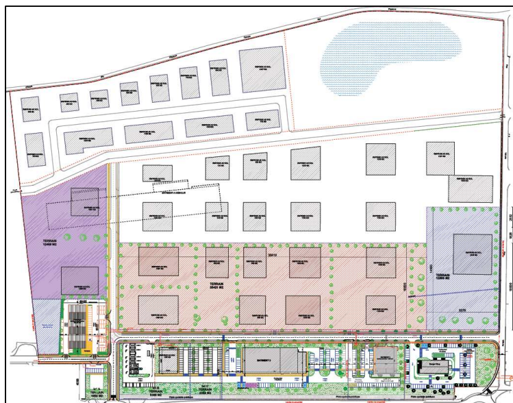
Figure 7. Version du projet au 24/06/2020.

Dans cette version l'aménagement des voiries est réduit au minimum, les accès secondaires seront aménagés par les lotisseurs à l'intérieur de macro-lots.